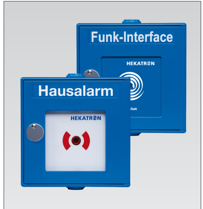
Abb. 01: Manueller Hausalarm und Funk-Interface in einem Gerät. Die mitgelieferten Aufkleber und Einleger können entsprechend der Anwendung gewählt und angebracht werden.